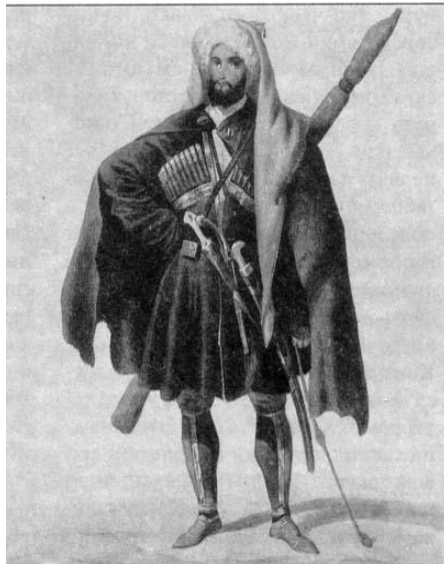
Рис2.Г.Гагарин Натухаец из Анапы

Для того, чтобы легче было представить словесный портрет, в линию вклинились компьютерные художники, готовые написать на холсте этот облик. Вот один из них (см. рис. № 1.) Пусть читатель сам судит, насколько написанный портрет соответствует описанию Захра Омар. Не трудно догадаться, что подобный облик черкеса - это выдача желаемого за действительность, ибо он никогда не существовал. Это компьютерная обработка, о чем и свидетельствует отмеченная на иллюстрации дата «31.01.97 год» Я же предлагаю оригинал, автор которого Г. Гагарин «Натухаец из Анапы» ( см. рис. № 2) . Давайте вместе сопоставим оригинал с подделкой.