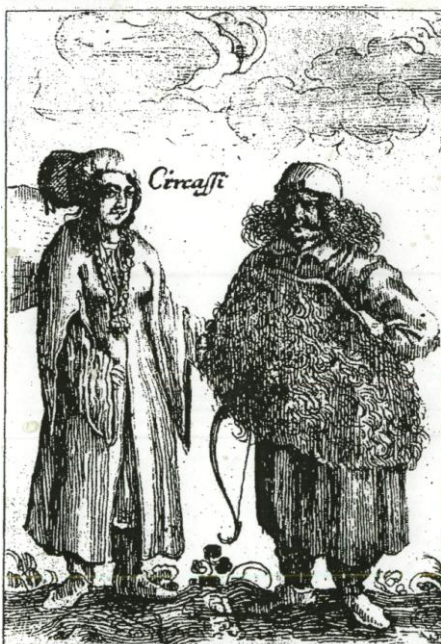
Рис. 8. Типы черкесов XVII в. Рис. из книги А. Олсария

Безусловно, грудь стала шире немного, но далеко не столь широка, чтобы сравнивать ее с грудью Бога, как сочиняет Захра Омар.