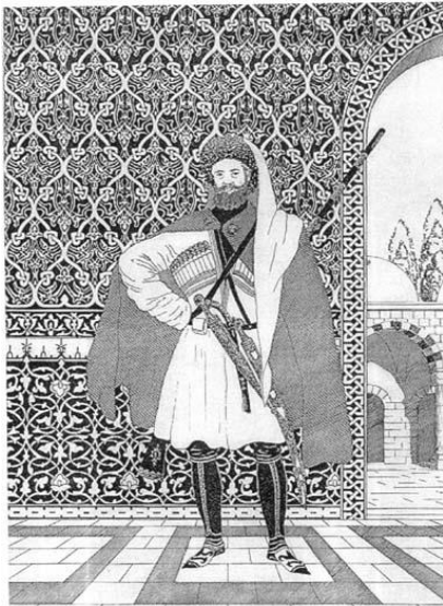
Рис1. Черкесский боевик 18в.