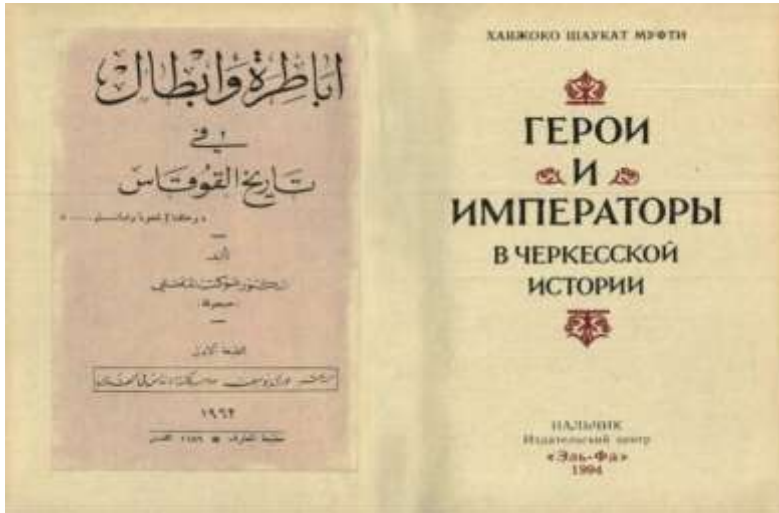
Рис. 8. Титульный лист книги Ш. аль-Муфти на арабском и ее нальчикского издания на русском языке.

история в один миг превратилась в черкесскую (адыгскую). Предлагаю вашему вниманию оригинал названия этой книги на арабском языке и искаженный в переводе на русском языке (рис.8).