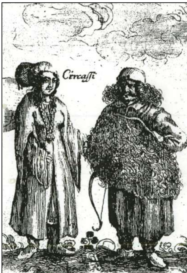
Рис.3. Черкес и черкешенка по А. Олеарию.

граничащие с крымскими татарами, живут в горах. У меня нет никакого доказательства, что они татары. Они белы лицом и телом, это свидетельствует о том, что это люди другой расы» 12 .