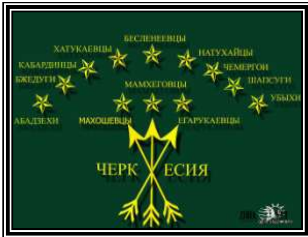
Рис. 5. Адыгский флаг с вписанными названиями западнокавказских племён.

Для начала предлагаю изображение адыгского флага с наименованиями двенадцати племён опубликованное на сайте http://zihia.org http://heku.ru . (рис. 5).