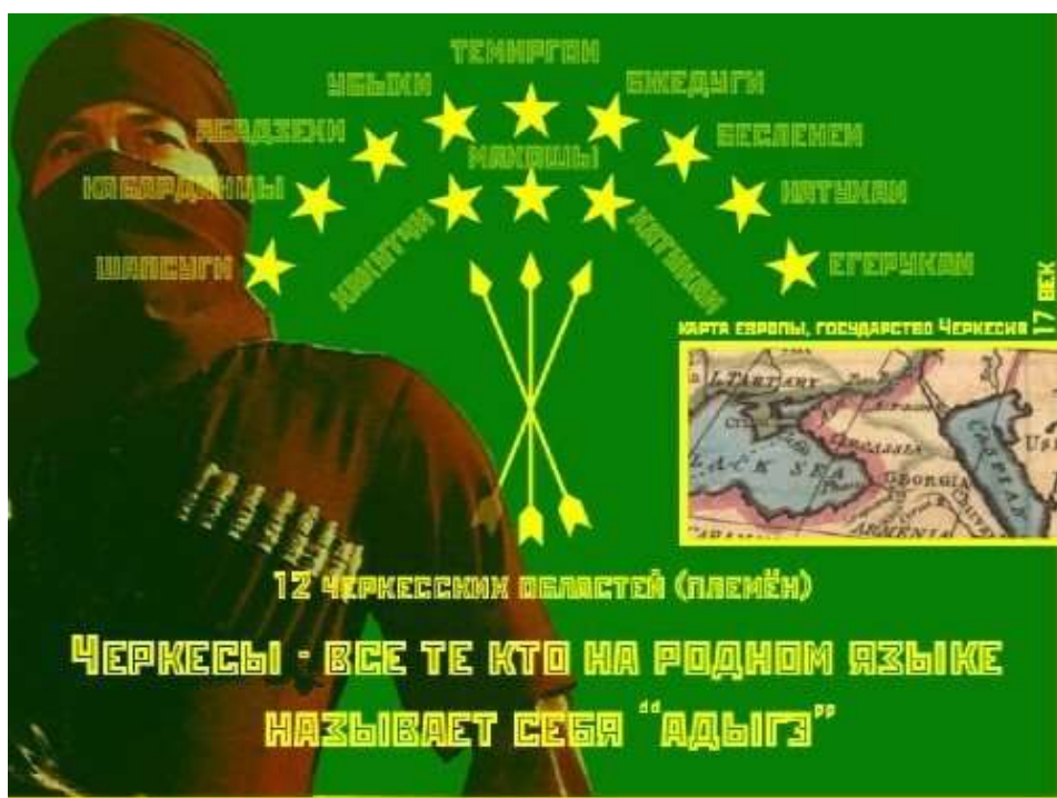
Рис. 4. Племенной состав черкесов согласно мнению адыгских националистов. По политическим мотивам (рис. 4). Через присвоение этого термина они стали претендовать на историю, земли и славу истинных черкесов.

Приведем здесь и мнение специалиста И. Ильинина: «Единочеркесской нации» не было и нет, так же как никогда не было «единогерманской» нации, включающей в себя австрийцев, голландцев и немецкоговорящих швейцарцев.